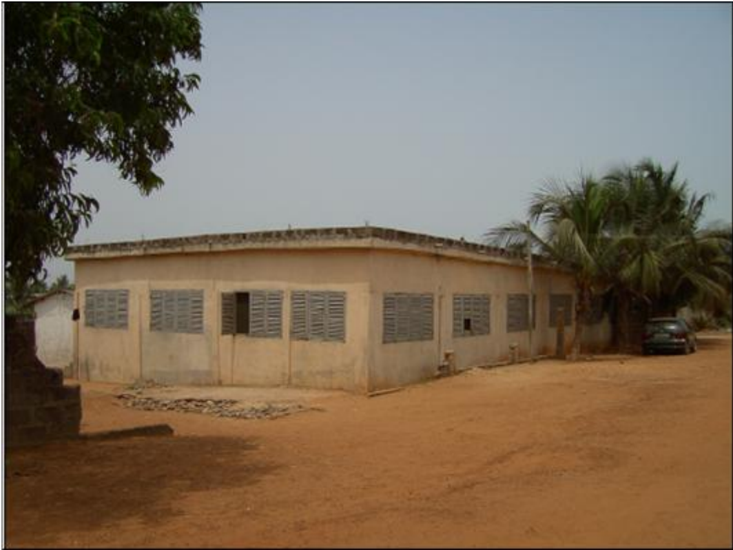
Vista desde punto 1