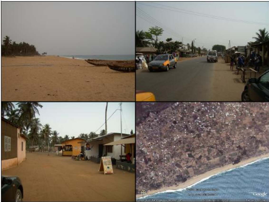
Denu: Playa, Carretera principal, Area Residencial, Vista satélite

Por otro lado, los precios son demasiado altos y las familias mas pobres no pueden permitírselo.