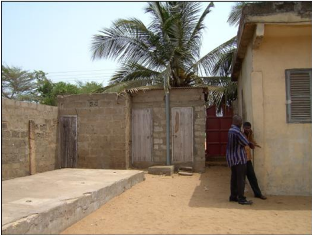
Vista desde punto 3