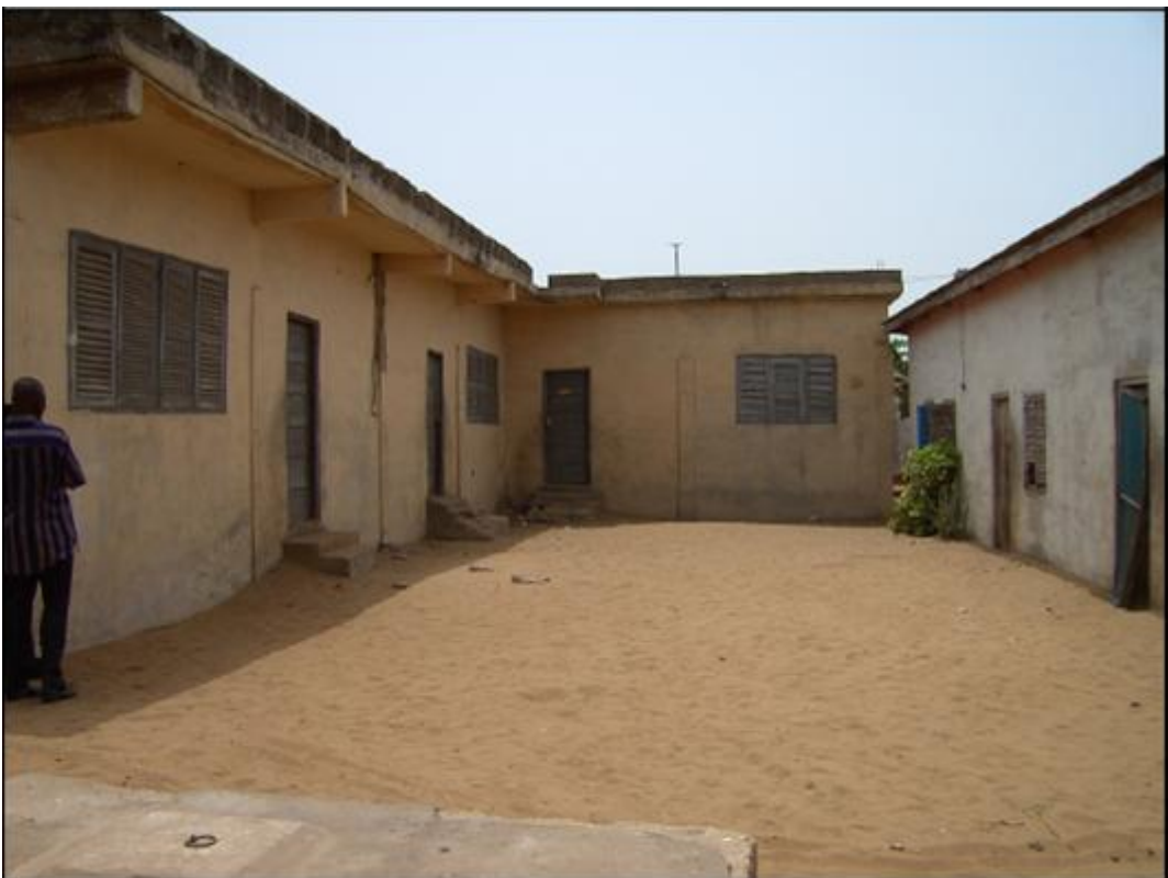
Vista desde punto 2