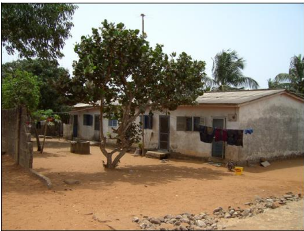
Vista desde punto 4